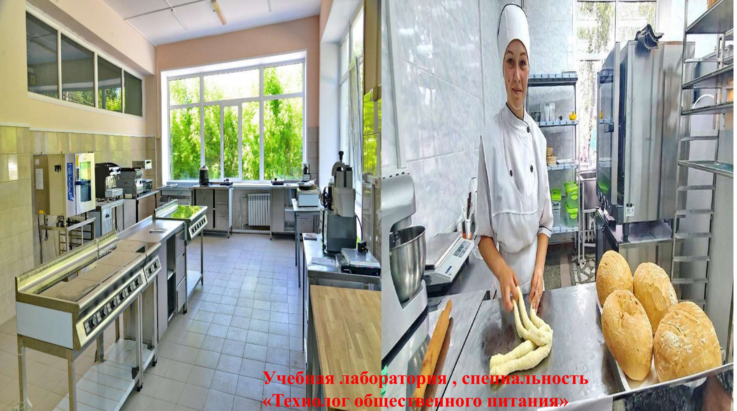
Учебная лаборатория, специальность «Технолог общественного питания»