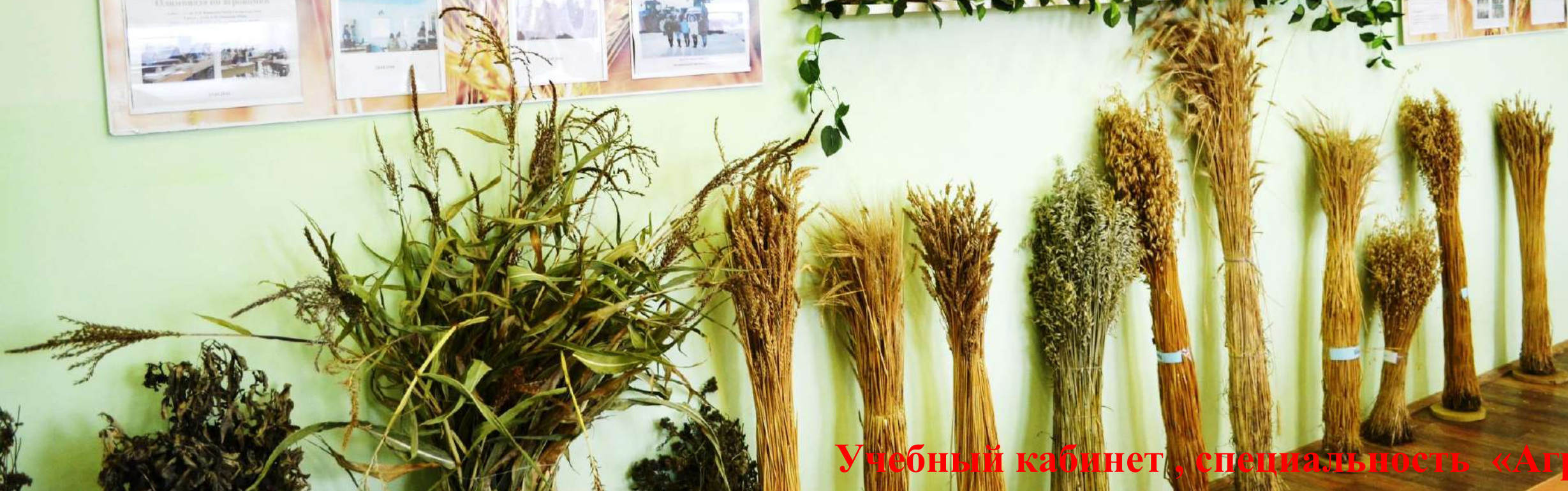
Учебный кабинет, специальность «Агрон...»