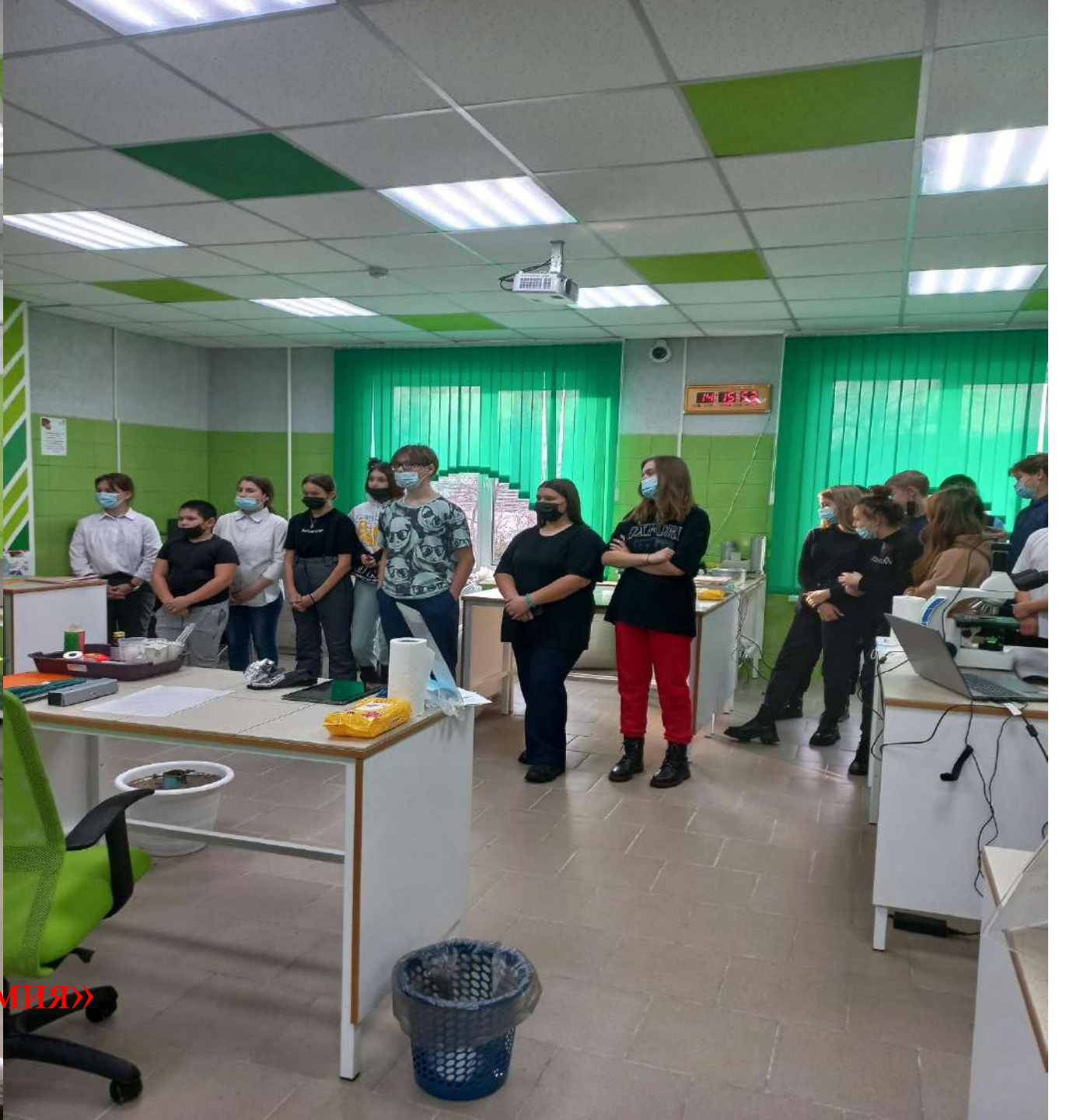
Лаборатория, специальность «Агрономия»