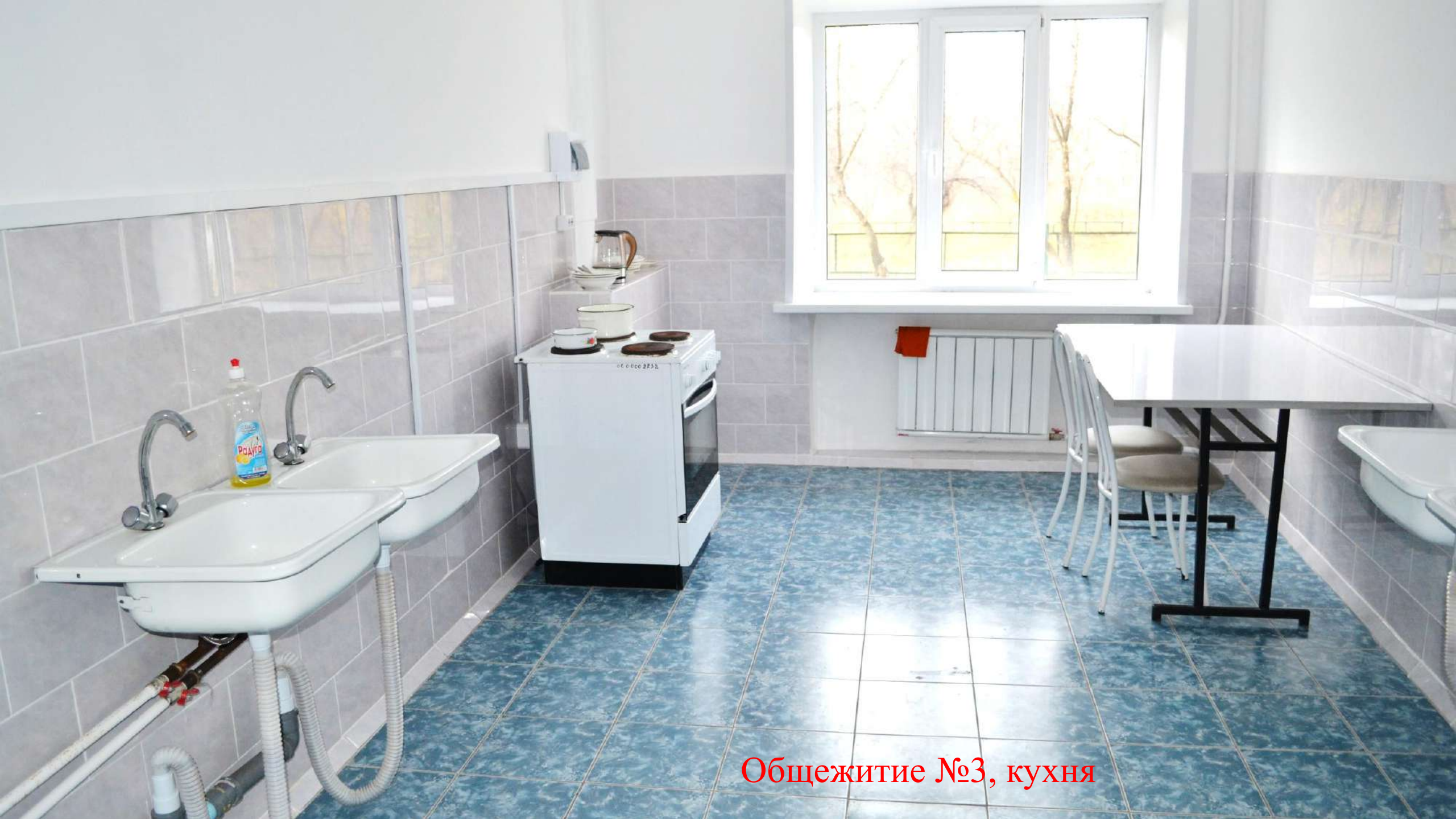
Общежитие №3, кухня