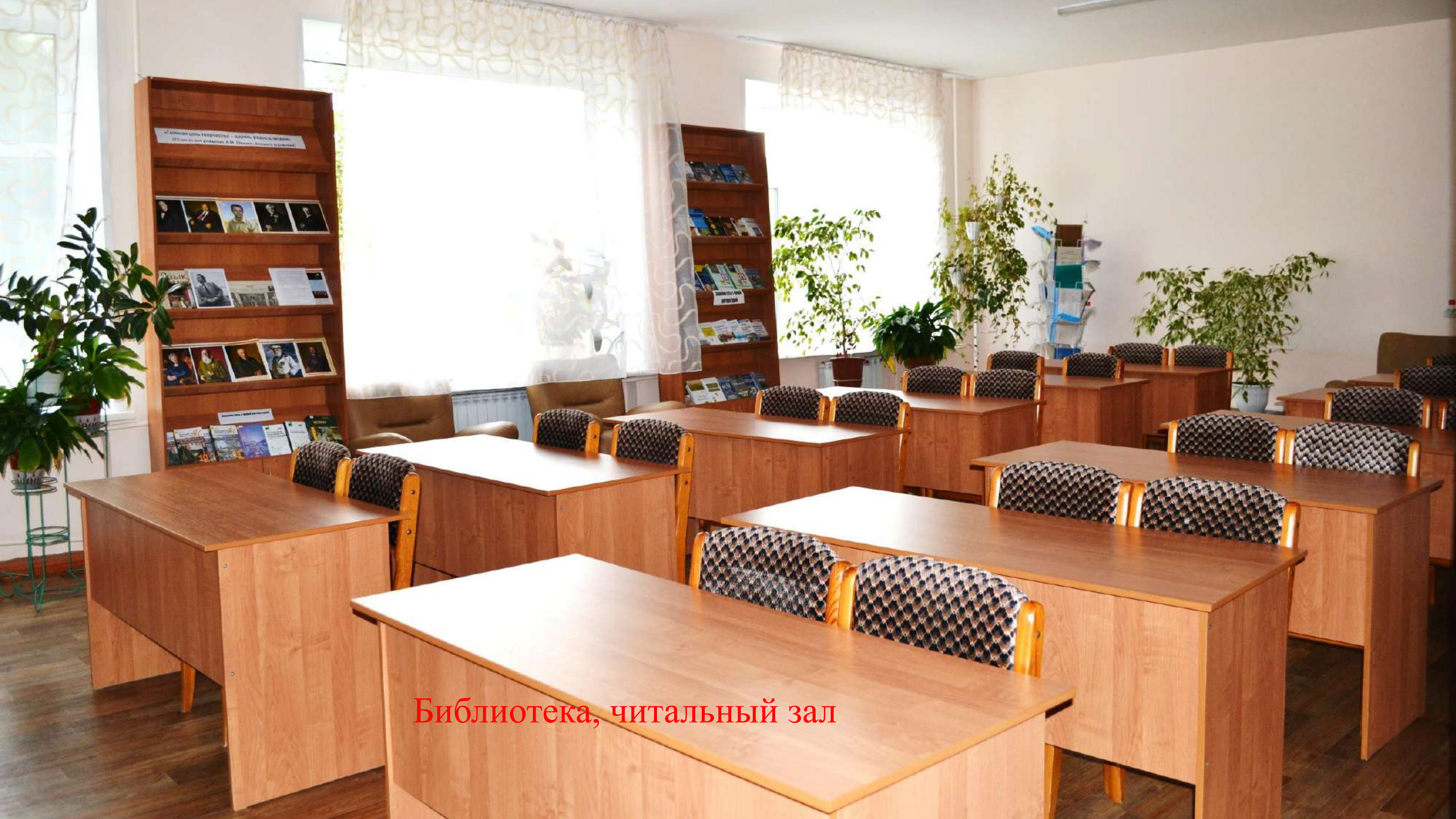
Библиотека, читальный зал