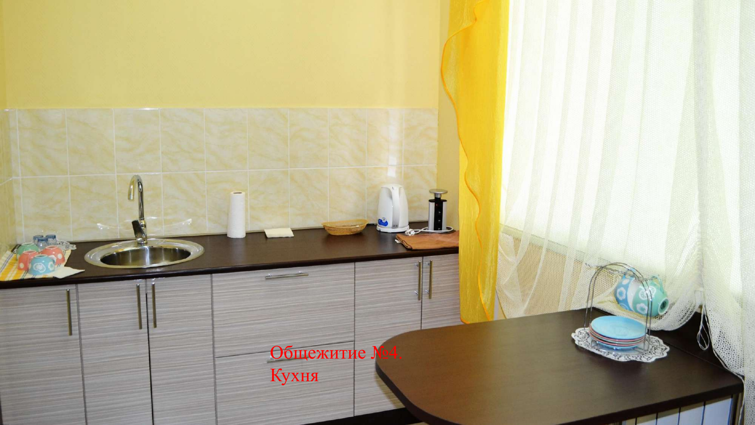
Общежитие №4. Кухня