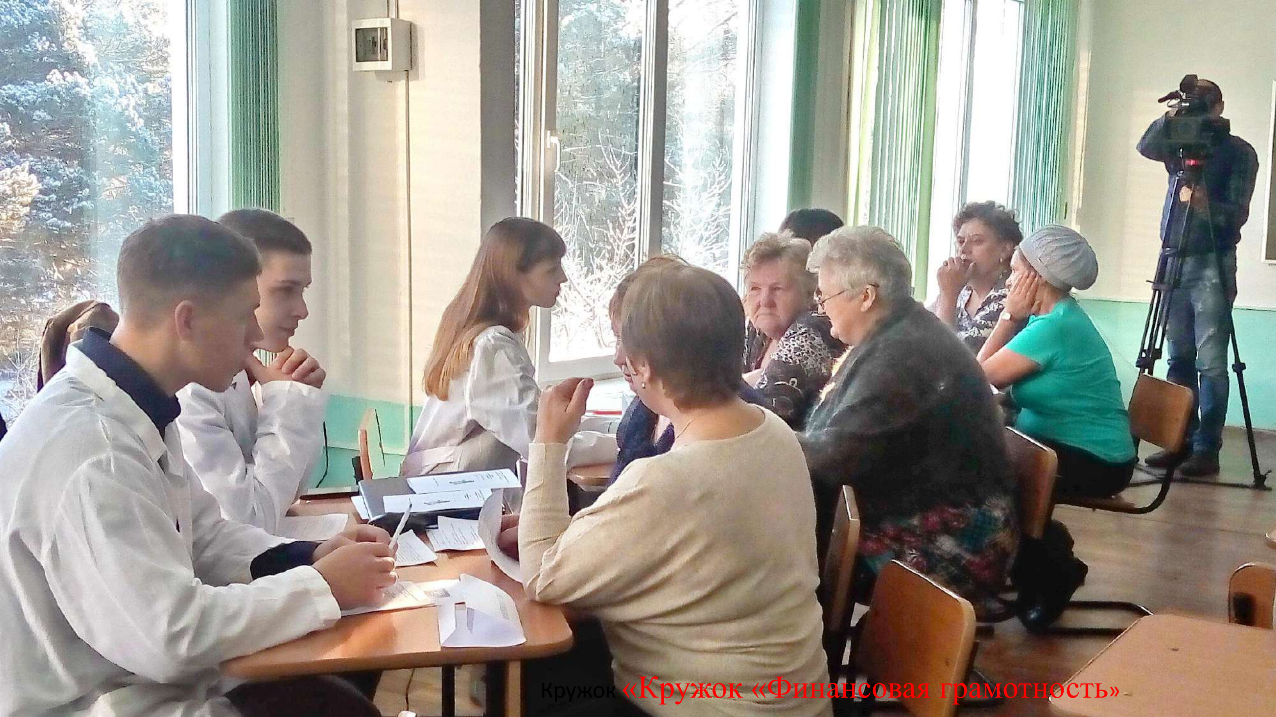
Кружок «Кружок «Финансовая грамотность»»