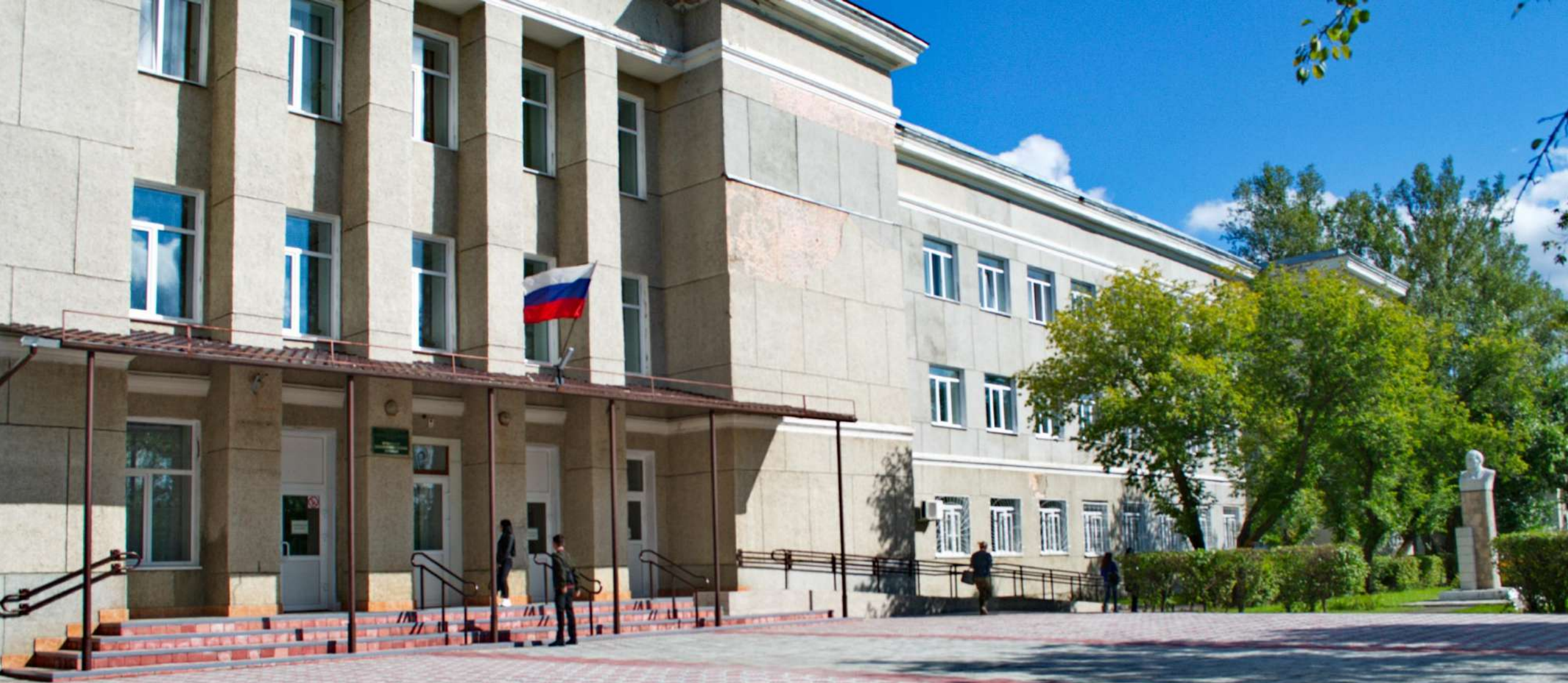
Учебный корпус 1