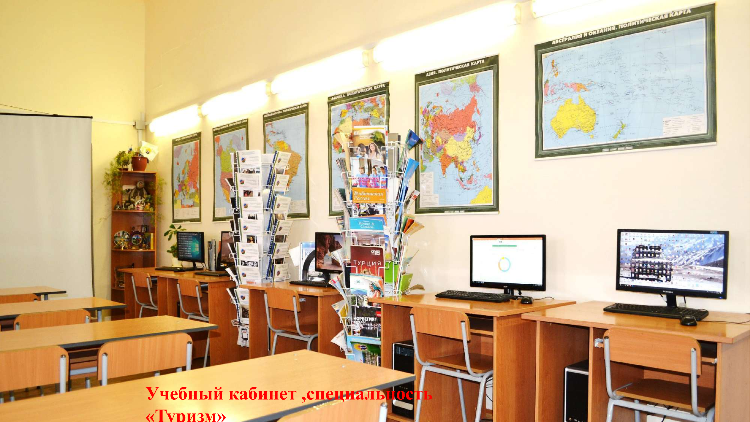
Учебный кабинет ,специальность «Туризм»