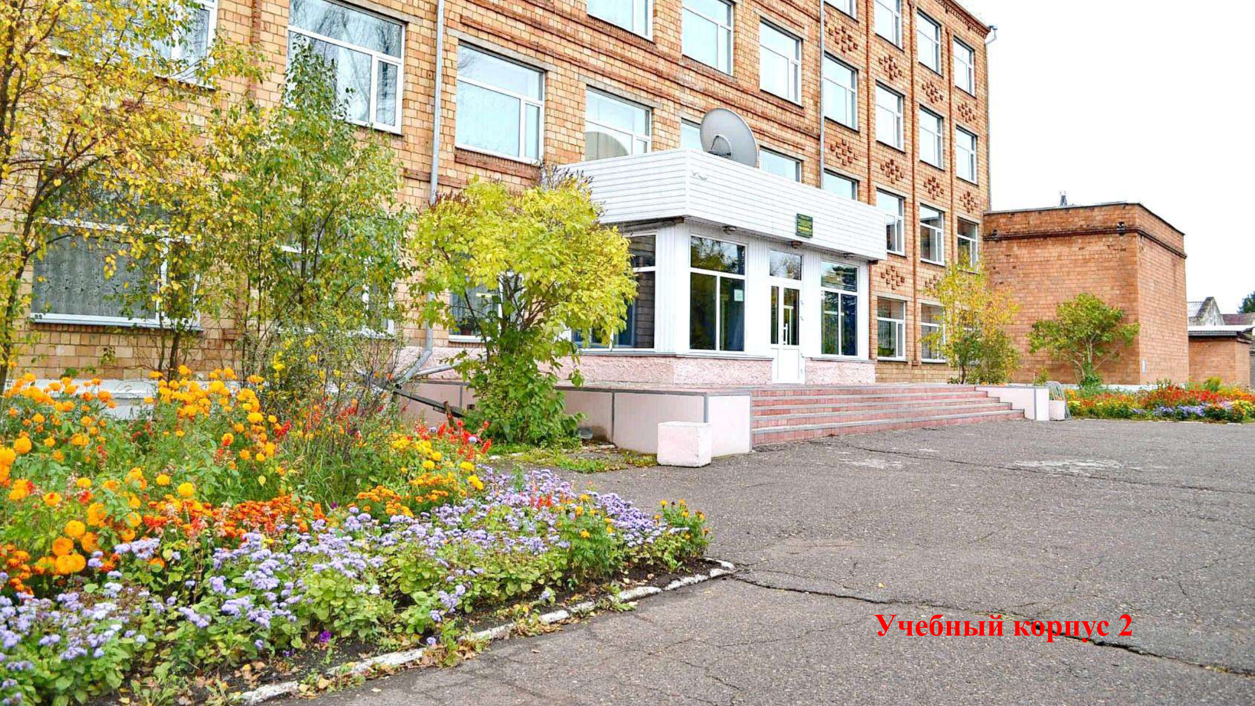
Учебный корпус 2