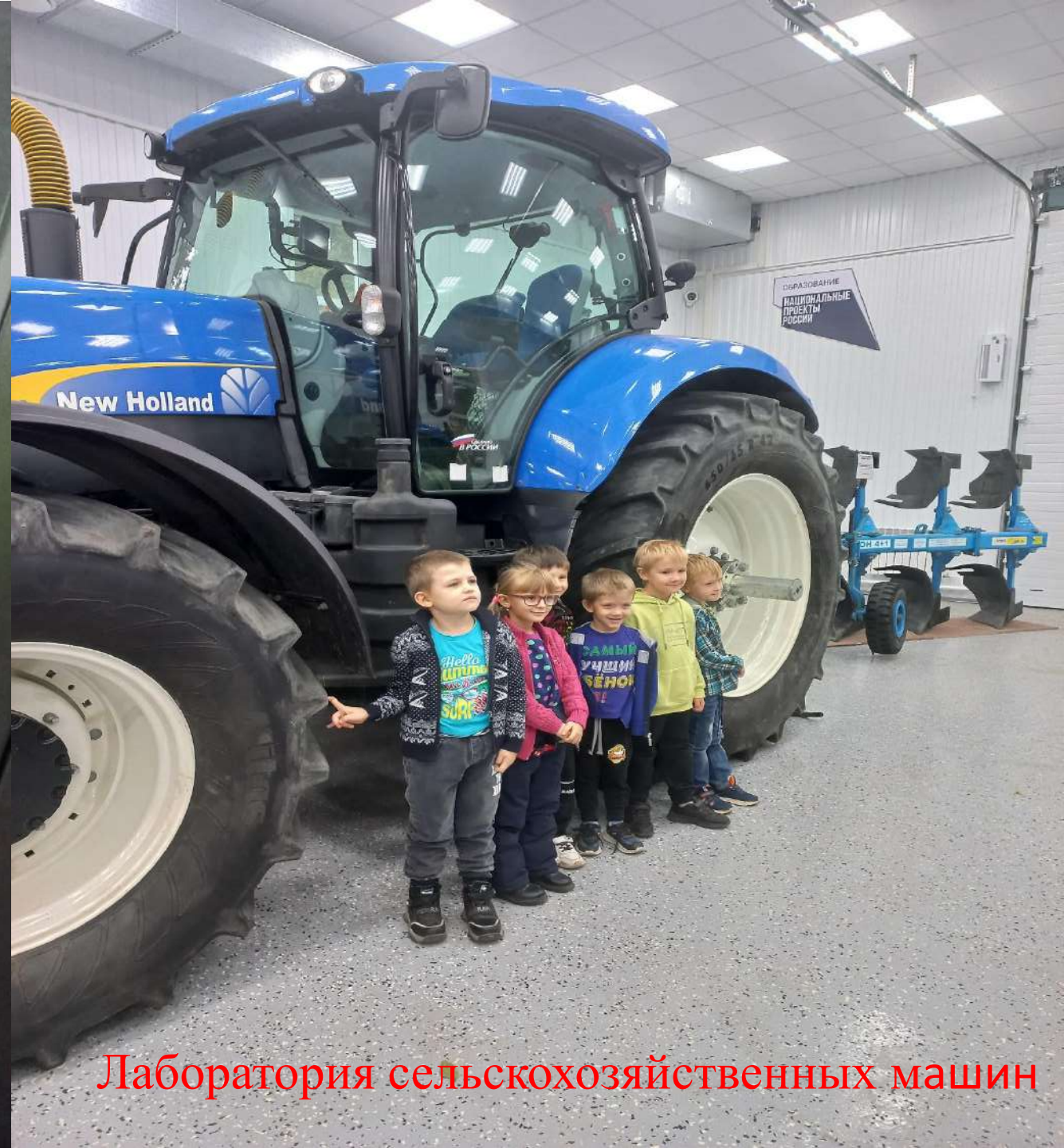
Лаборатория сельскохозяйственных машин