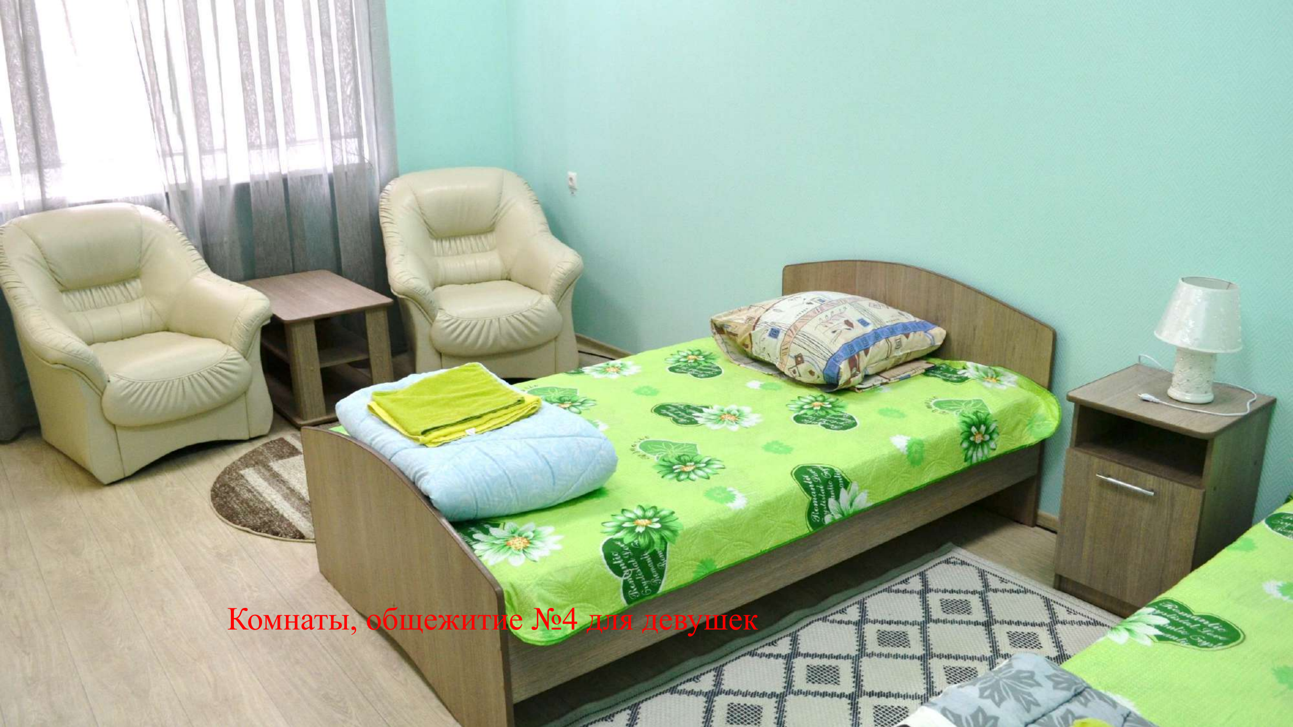
Комнаты, общежитие №4 для девушек