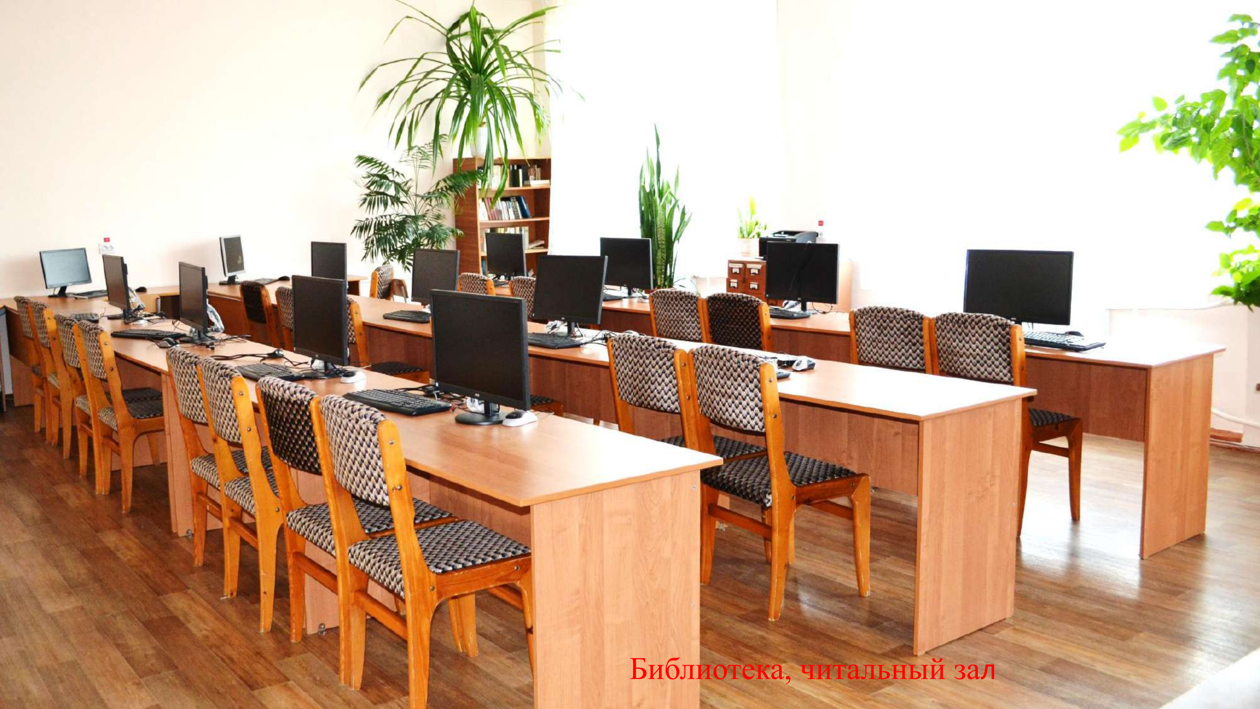
Библиотека, читальный зал