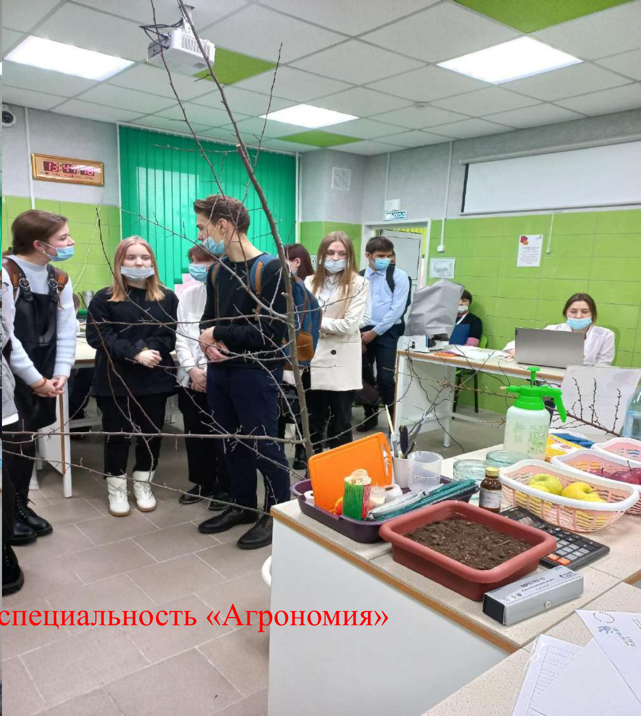
Лаборатория, специальность «Агрономия»