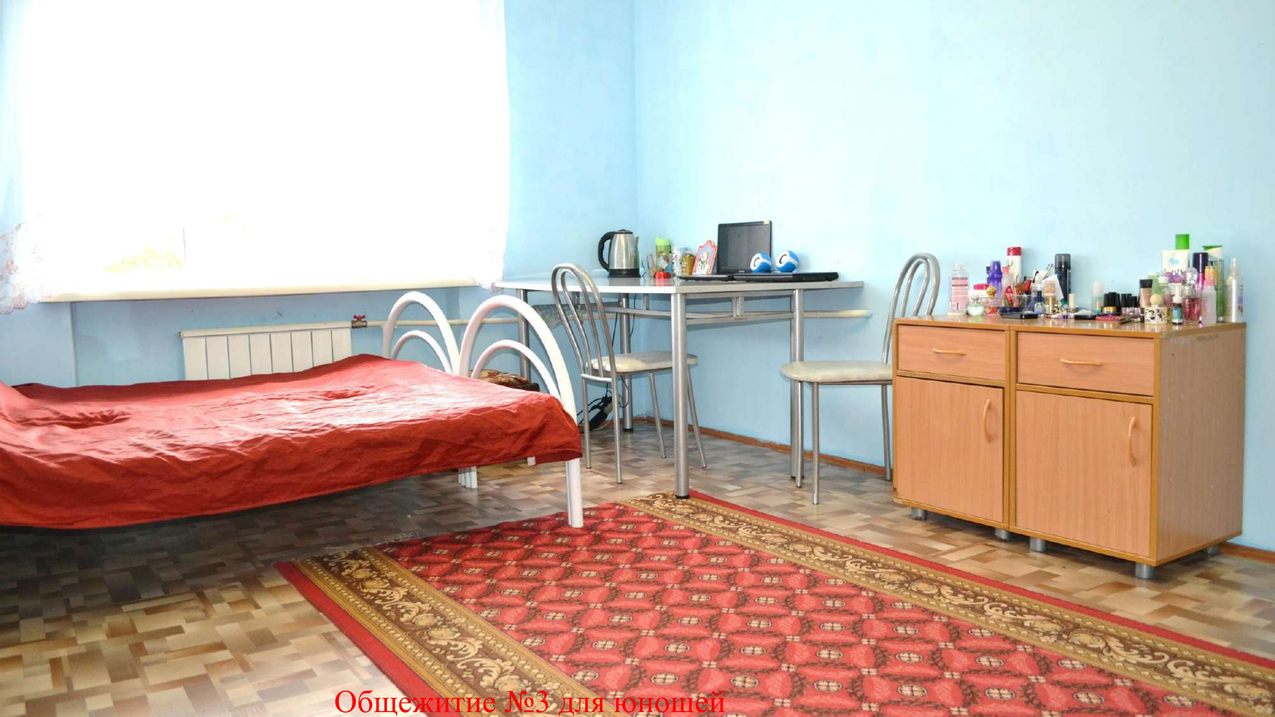
Общежитие №3 для юношей