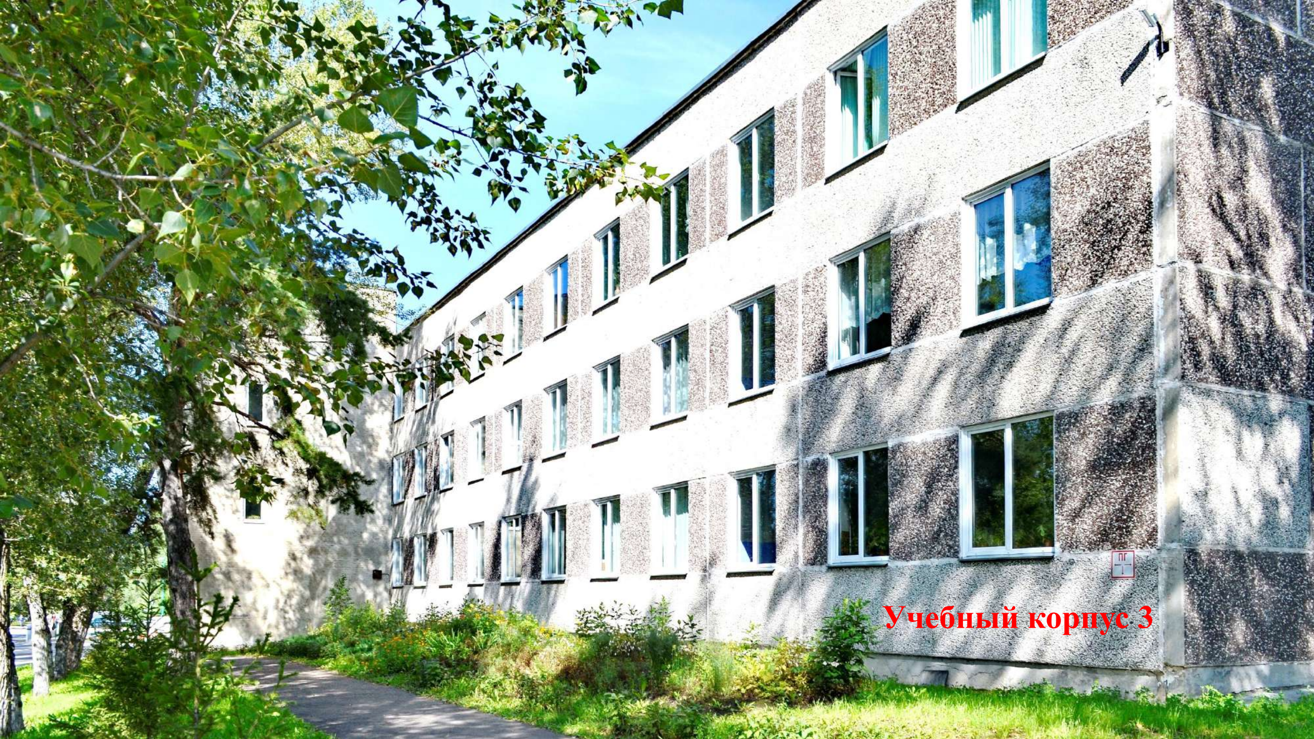
Учебный корпус 3