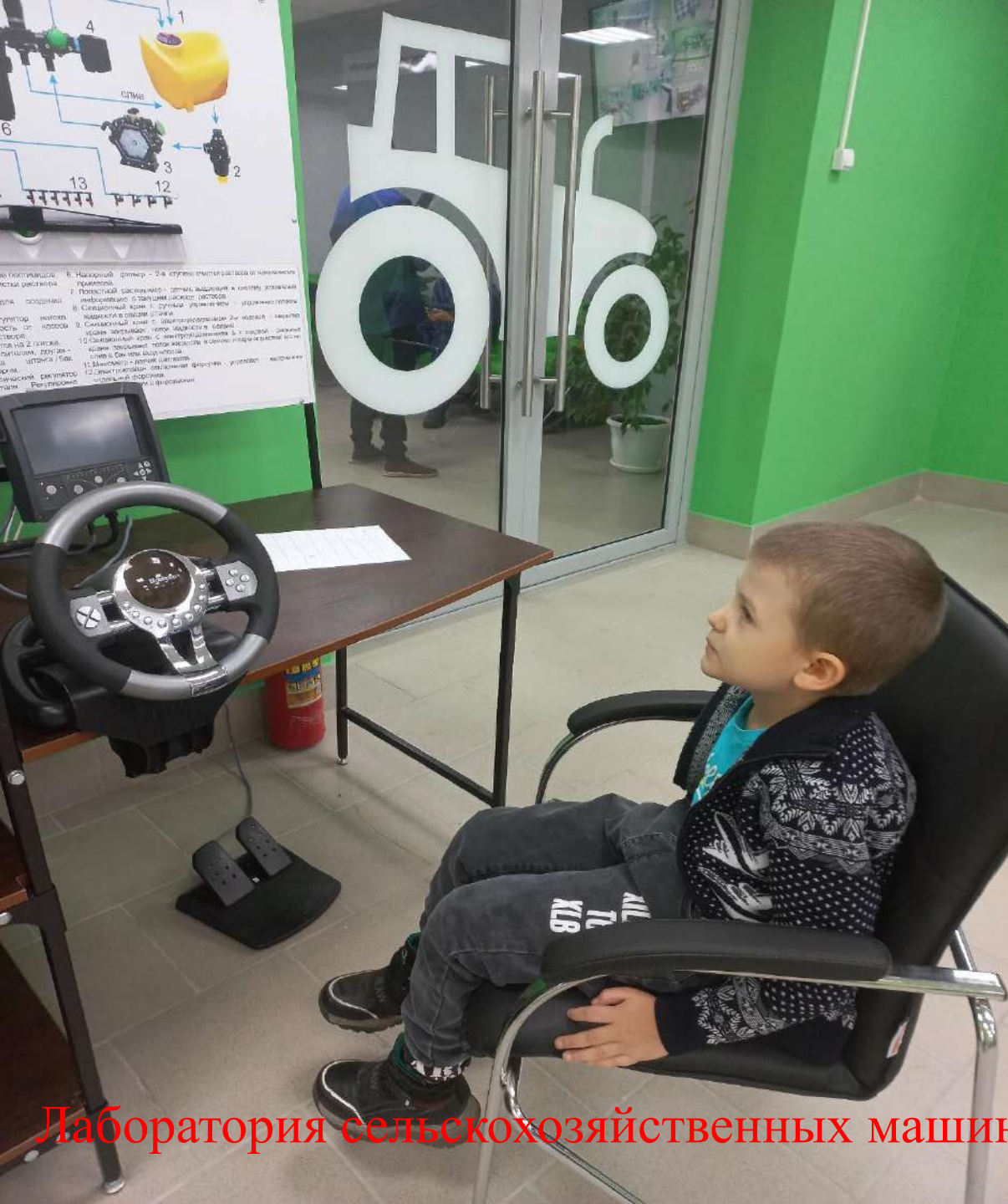
Лаборатория сельскохозяйственных машин